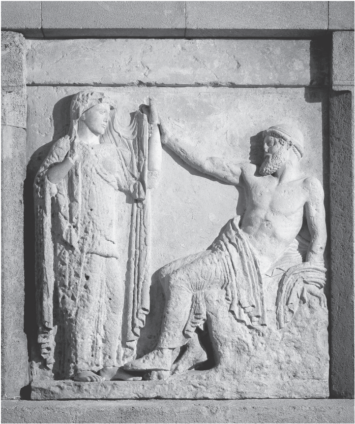
Abb. 1 Metope des Tempels E in Selinunt/Sizilien (um 470 v. Chr.); Palermo, Museo Nazionale Archeologico Die Metope war an prominenter Stelle rechts über dem Eingang zur Cella angebracht. Sie zeigt links Hera, aufrecht stehend, und rechts Zeus, auf einem Felsen sitzend, der wahrscheinlich auf den von Homer besungenen Berg Ida Bezug nimmt; die lässige Haltung des Zeus sowie sein verrutschtes Gewand zeigen ihn vom Verlangen ergriffen. Die ›Inbesitznahme‹ der Hera durch den Olympier wird konkret durch das Fassen ihres Armes veranschaulicht, ein Gestus der von zahlreichen Hochzeitsbildern auf Vasen bekannt ist. Auch der Gestus, der Hera, die einen Schleier lüftet, kommt häufig auf Bildern der Heirat vor. Hera erscheint somit auf der Metope als jungfräuliche Braut.